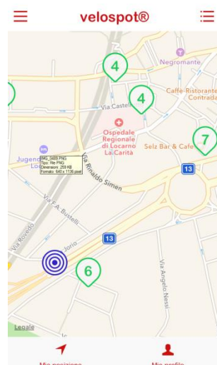
(estratto app – pianta con indicazione biciclette disponibili e