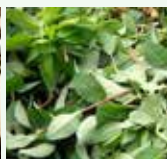
Scarti vegetali del giardinaggio: erba, rametti, foglie, fiori, rami