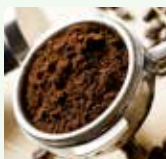
Fondi di caffè o filtri di the