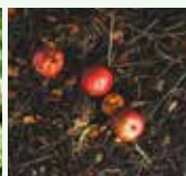
Residui non decomposti del precedente processo di compostaggio