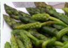
Scarti organici di cucina vegetali cotti