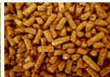
Lettiere vegetali di piccoli animali non carnivori